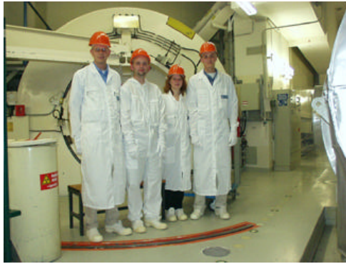
Die Glinder vor dem Einstieg zum Reaktordruckbehälter

Anfang August besuchte die Junge Union Glinde das Kernkraftwerk Krümmel. Anlass war die öffentliche Diskussion um die Kernenergie, genauso wie die regelmäßig stattfindenden Castor-Transporte. Mit einer Besetzung von 4 Personen ging es los, so dass die Führung sehr intensiv war. Zur Freude aller bescherte der Besuch eine Flut von Informationen. (Unser Glinder Ingenieur war total begeistert!) Die eigene Erfahrung zählt auch hier mehr als das „Hören-Sagen“. Wir können allen anderen Ortsverbänden diese nur empfehlen.